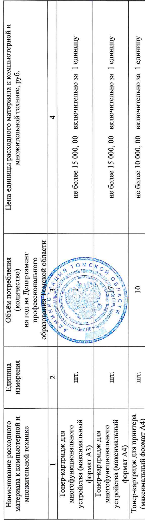
Таблица 3 Расходные материалы для оргтехники